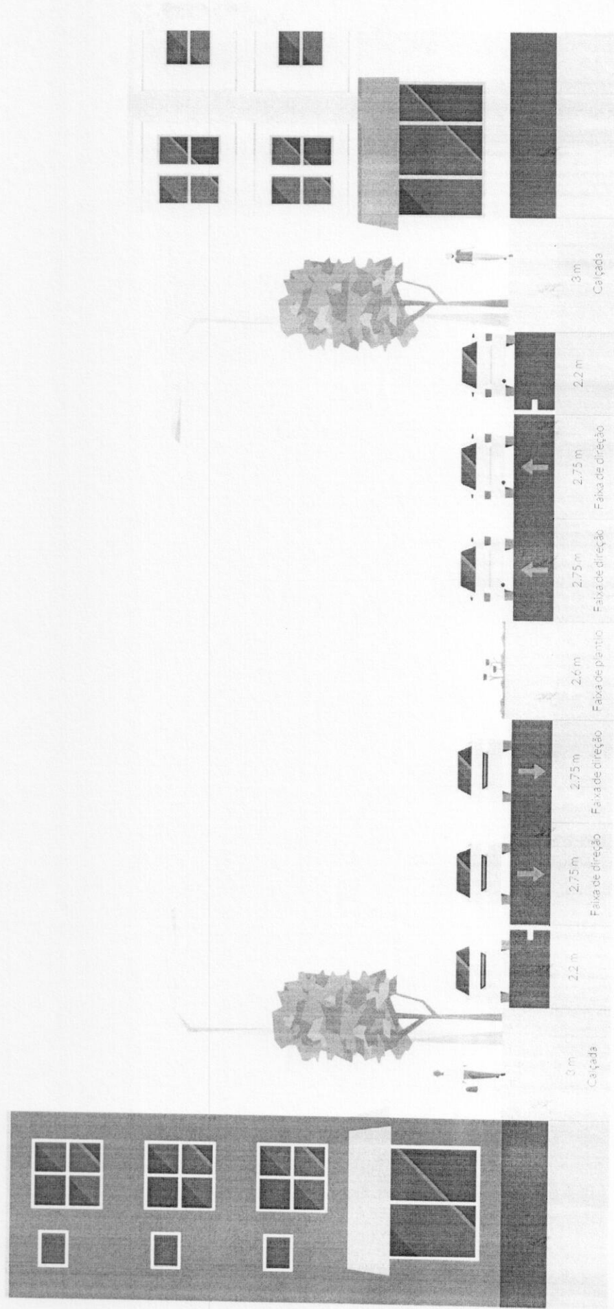
Figura 2 - Via Arterial

www.mandaguacu.pr.gov.br - e-mail: adm@mandaguacu.pr.gov.br