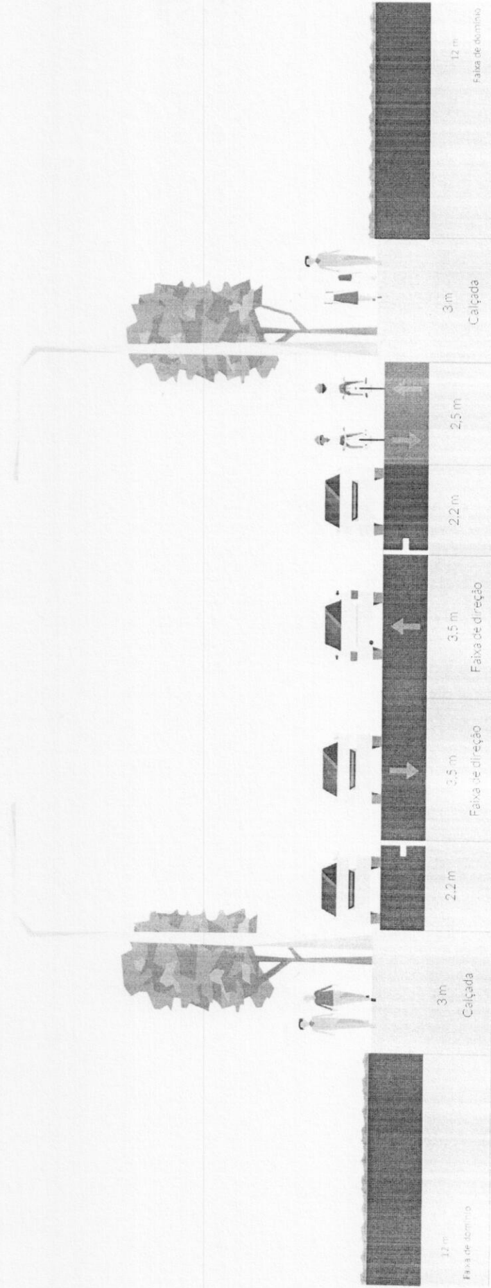
Figura 1 - Via Estrutural

www.mandaguacu.pr.gov.br - e-mail: adm@mandaguacu.pr.gov.br